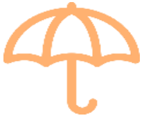
TABLEAU DES PRESTATIONS

Détails des règlements des prestations prévoyance et des informations fiscales.